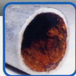
汚れた水道管内部 (鉄管の場合)